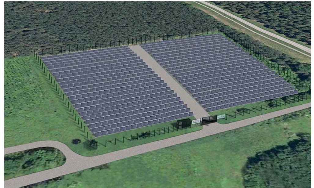
Photovoltaikanlage SOLARPARK Westheim aus der Luft